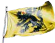
Vlaamse Leeuw Le Lion des Flandres