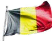
Vlag van België Drapeau de la Belgique