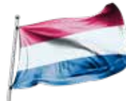
Vlag van Nederland Drapeau des Pays-Bas