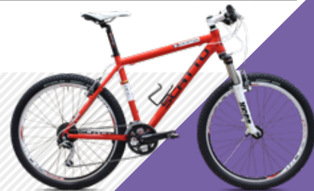
KRYPTON DEORE XT 3X9 V-BRAKE (LTD) € 699 • 12,60 KG

FRAMESET / ENSEMBLE CADRE € 199 • 1,50 KG (INCL. VORK / FOURCE + LAKKING / PEINTURE + BALHOOFD / JEU DIRECT) / FRAME SPECIFICATIES CARACTERISTIQUE / TECHNIQUE DE CADRE ALU TB TUBES OPTIES VORKEN BIJ FRAME / OPTIONS FOURCHES CHEZ CADRES / VAST/FIXE - CARBON RIGID (26 ER -27 ER -29 ER ) € 300 / VEREND SR RAIDON (29 ER ) € 250 / VEREND / SUSPESION SR XCM (26 ER ) € 100