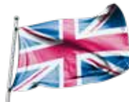
Vlag van het Verenigd Koninkrijk Drapeau du Royaume-Uni

Vlaggen van andere landen zijn ook verkrijgbaar / Drapeaux d'autres pays sont aussi disponible